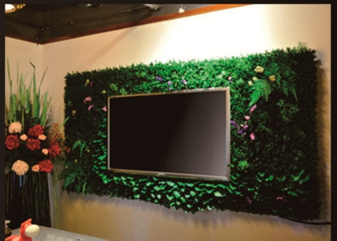
保真花卉电视背景墙、植物墙（例2）