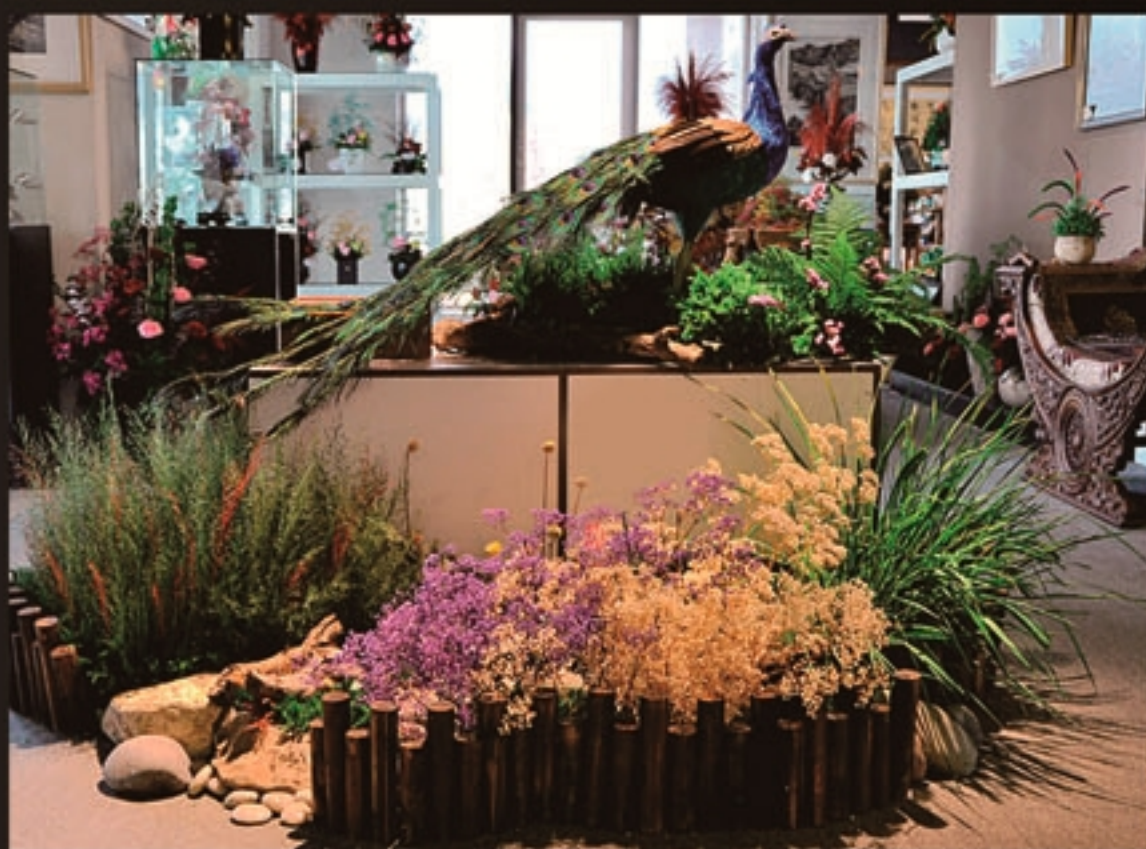
适用于办公室、家居等场所的室内造景