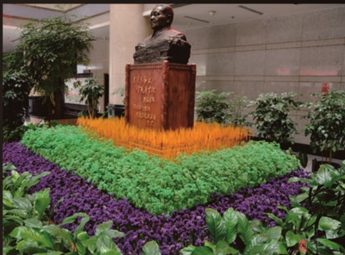
适用于学校、博物馆等场所的室内造景