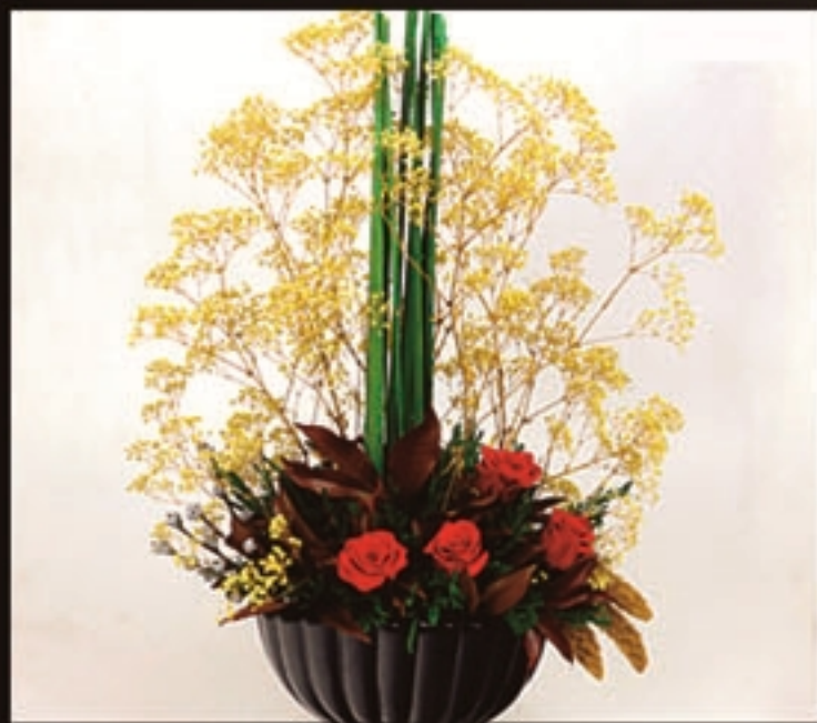
【商品名称】秋满仓 【商品尺寸】50*40*70cm