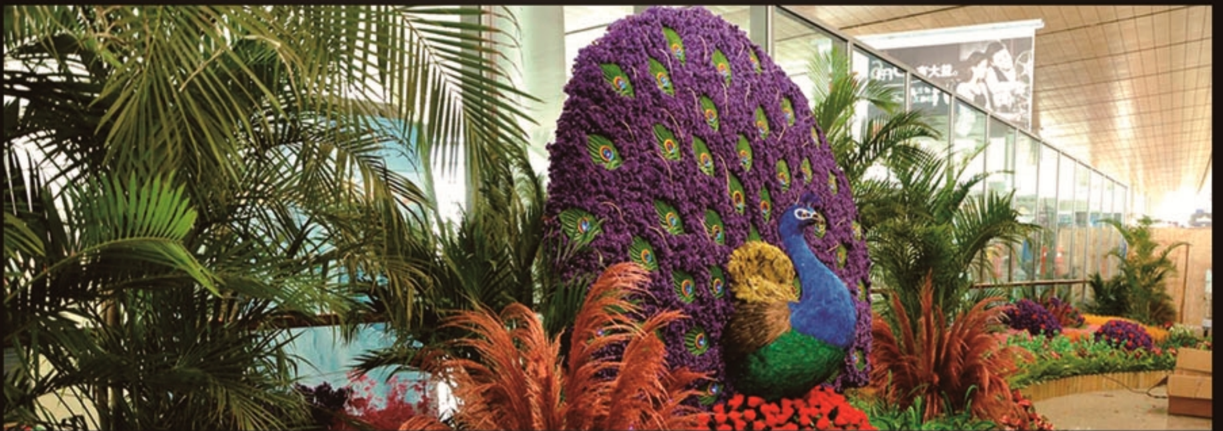
适用于机场的保真花卉大型室内造景