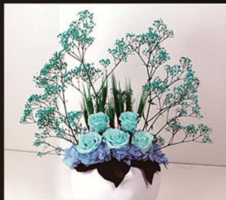
【商品名称】蓝海 【商品尺寸】40*22*55cm