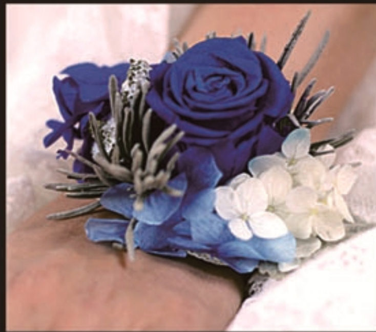
【商品名称】胸花·蓝玫瑰