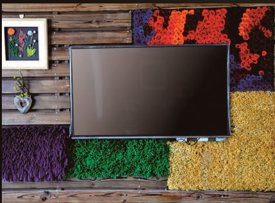
保真花卉电视背景墙、植物墙（例1）