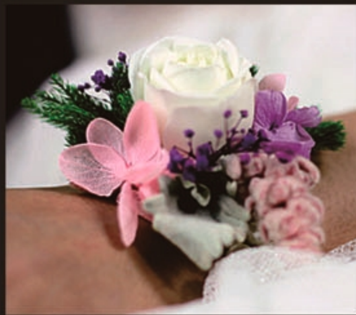
【商品名称】胸花·白玫瑰