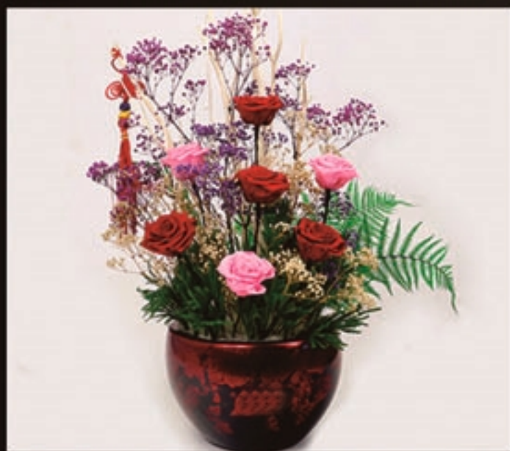
【商品名称】好运来 【商品尺寸】60*45*81cm