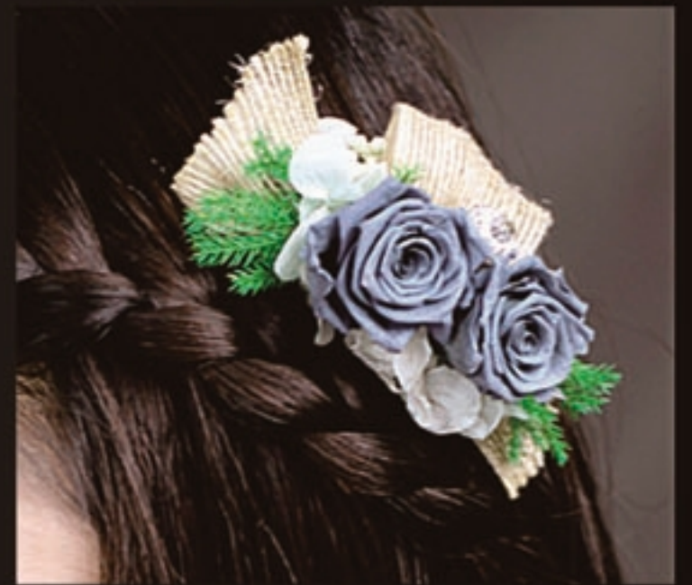
【商品名称】头花·怀旧