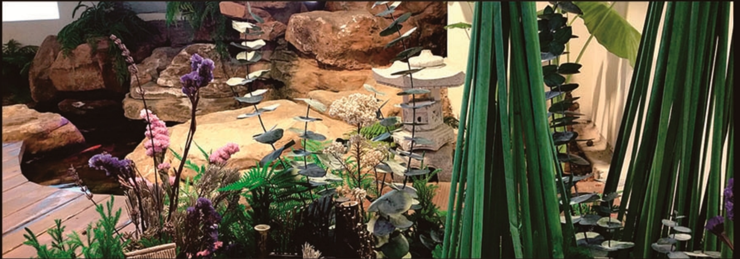
适用于家居、办公室、餐厅等场所的室内造景