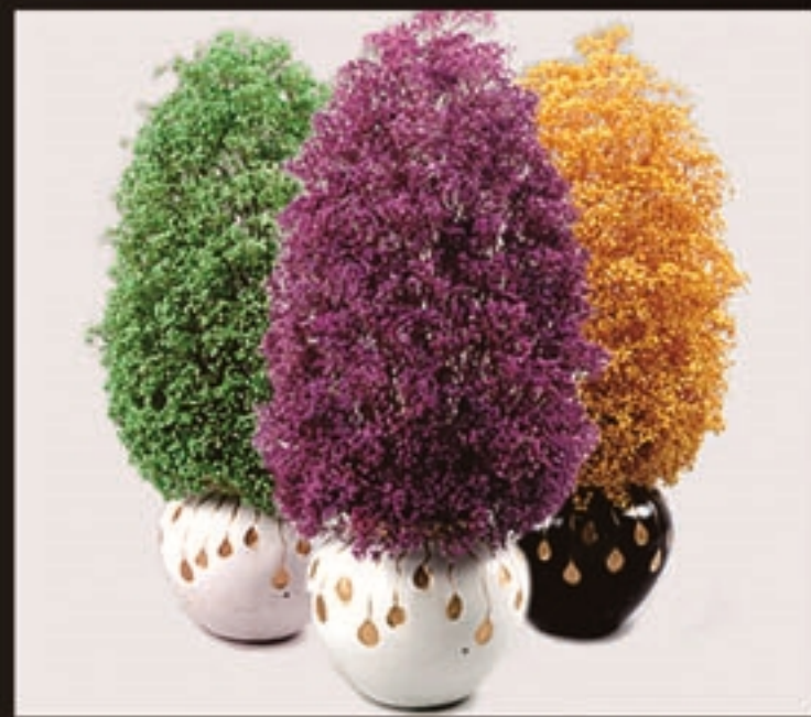
【商品名称】七彩云南(孔雀) 【商品尺寸】40*40*70cm