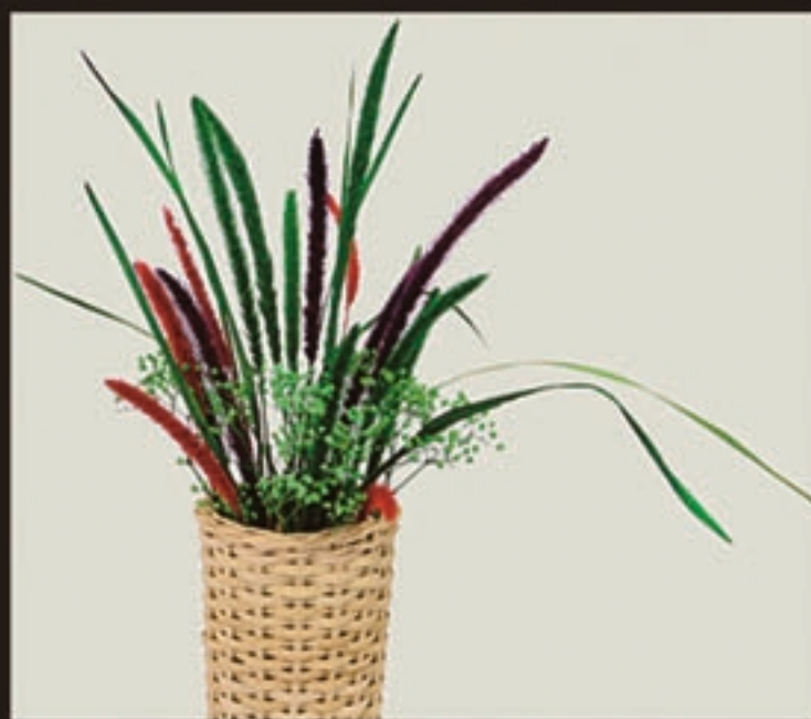
【商品名称】春之舞 【商品尺寸】60*50*55cm