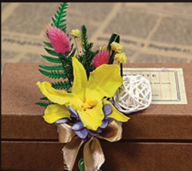
【商品名称】胸花·黄兰