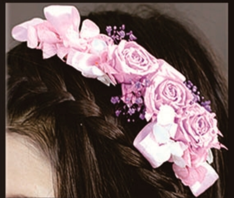
【商品名称】头花·少女