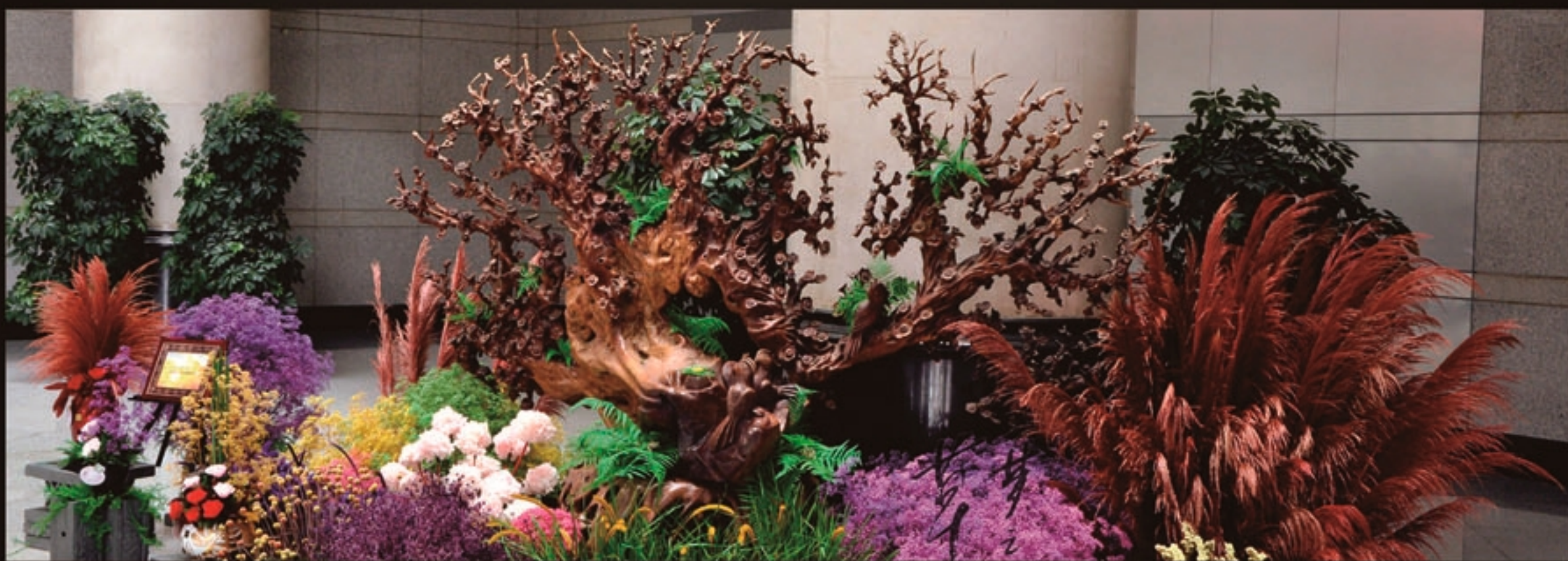
适用于酒店、办公室、商场等大型建筑的室内造景