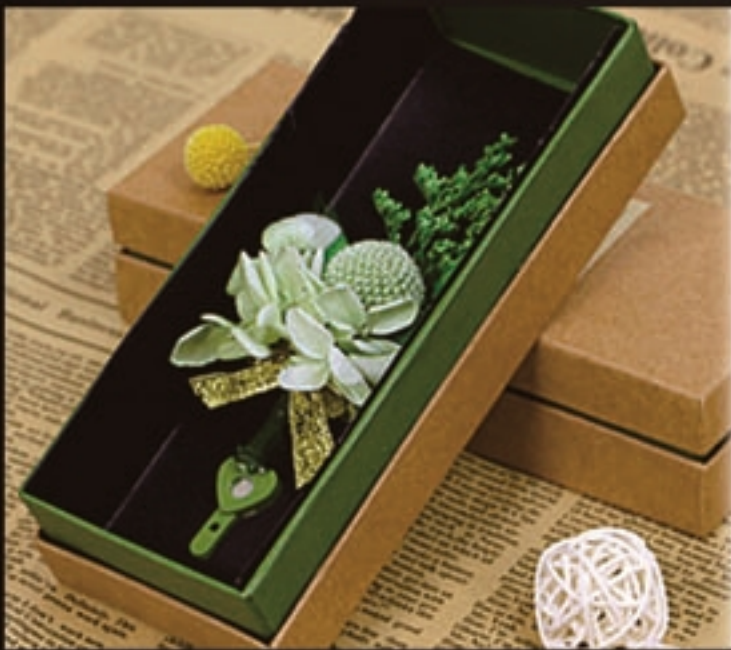
【商品名称】胸花·黄金球