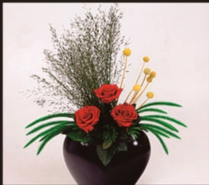
【商品名称】往事2 【商品尺寸】45*30*70cm